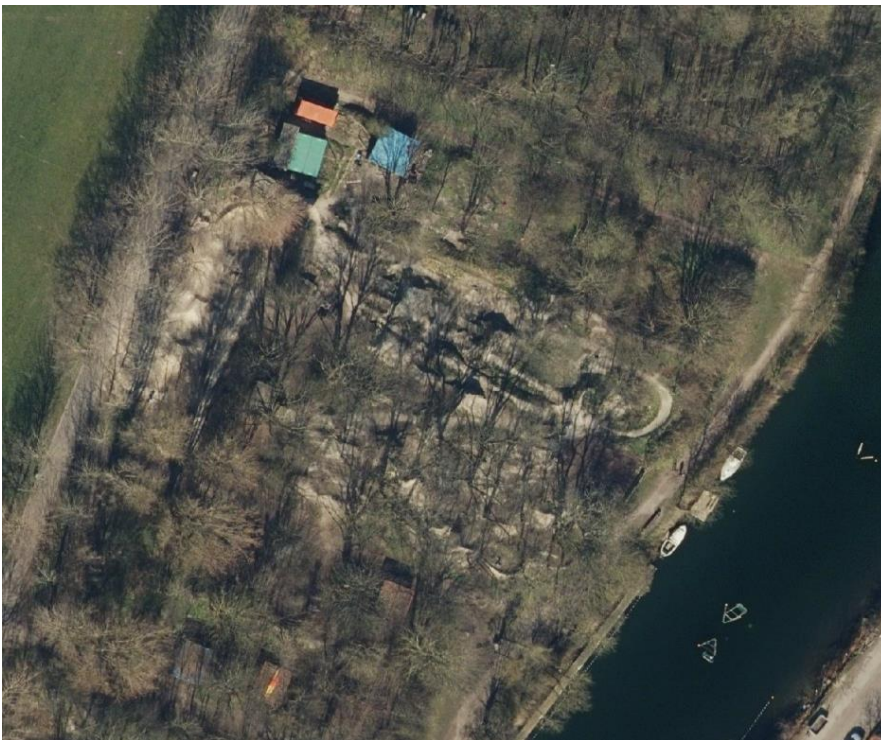
Luftbillede fra 2020.

Etablering af hop ved påkørsel af 300-400 t jord samt graveaktiviteter i de historiske krudtvolve har medført, at voldanlæggets udenværk i dag har mistet sin oprindelige karakter. Det er Område for Bygningers vurdering, at der er foretaget så væsentlige indgreb i det oprindelige landskab, at ændringerne påvirker fortidsmindets fremtræden som voldanlæg og dermed forstyrrer oplevelsen af fortidsmindet som et landskabselement.