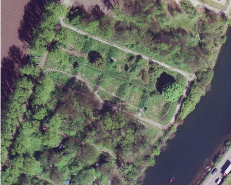
Luftbillede fra 2001.